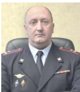
Олег Николаевич БОГУН, Главный Государственный инспектор безопасности дорожного движения по Ростовской области

Пусть ваша дорога всегда будет безопасной, благополучия вам и вашим семьям!